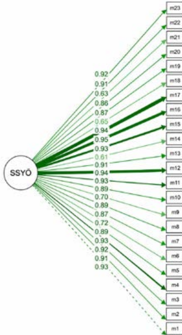
Şekil 2: DFA Yol Diyagramı: Spiritüel Şifa Yönelimleri Ölçeği'nin Tek Faktörlü Yapısı

Tablo 6'da DFA kapsamında alt boyutlar arası korelasyonlar verilmiştir. Tablo 6'ya göre, Spiritüel Şifa Yönelimleri Ölçeği kapsamında ölçülen yapılar arasında genel olarak orta ile yüksek düzeyde pozitif korelasyonlar bulunmaktadır. Bu durum, maddelerin ölçtüğü alt kavramların birbirleriyle ilişkili ancak ayrıştırılabilir olduğunu göstermektedir ve tek faktörlü model yapısını destekler niteliktedir.