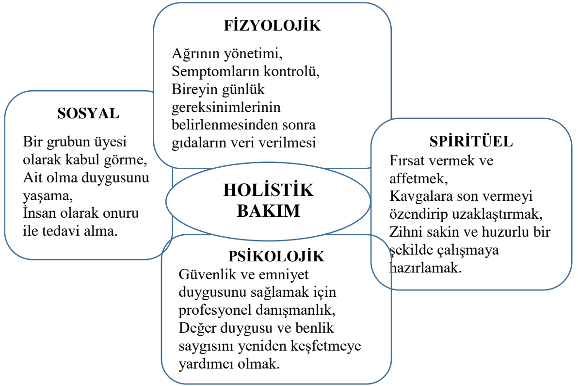
Şekil 1.2: Holistik Bakımın Bileşenleri (: http://www.practicalnursing.org/importance-holistic-nursing-care-how-completely-care-patients . Erişim Tarihi: 13 Aralık 2023)

Kronik hastalıklarda, ölümcül hastalığı olanlarda, tanı ve tedavi süreci zor olan hastalarda, ileri hasta olanlarda ölüm korkusu ve çaresizlik gibi duyguların yaşanıp artması ile hayatına yeni anlam katma, sevilme, aidiyet duygusunun artması, çevresi ve sevdikleri tarafından kabul edilme gibi manevi ihtiyaçlar ön plana çıkmaktadır (Bölüktaş, 2018:55). Maneviyat kanser hastalarının hastalıklarının seyri sırasında kendilerine, başkalarına ya da daha yüksek bir güce bağlanarak semptomlarını yönetmelerine, hayatlarına anlam ve amaç bulmalarına, umutlarını korumalarına yardımcı olabilir. Ayrıca tedavisi bitmiş olumlu sonuçlar almış hastalar için de önemli bir kavramdır. Çünkü bu bireyler yaşamı tehdit eden bir hastalıktan sonra maneviyatları ile daha çok karşı karşıya kalırlar (Zumstein-Shaha ve diğ., 2020: 2).