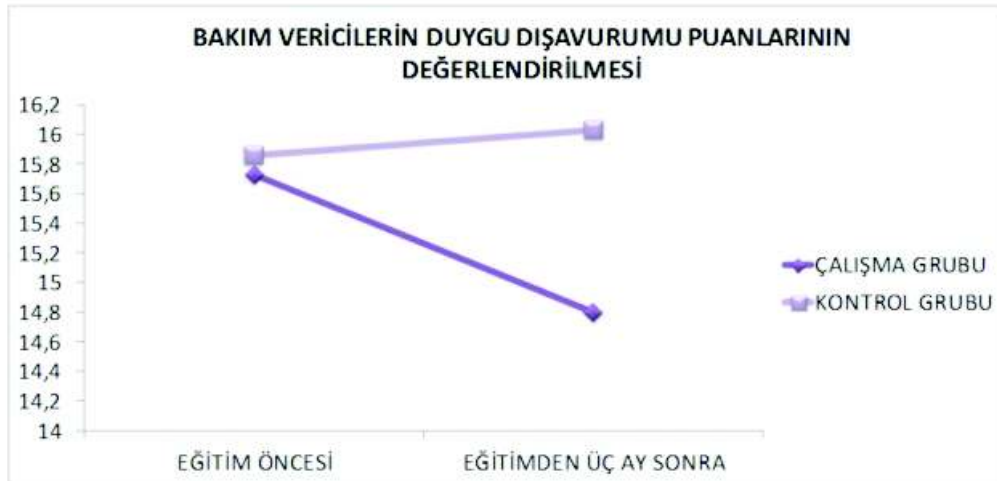
Grafik 1. Bakım vericilerin duygu dışavurum puanlarının değerlendirilmesi

Çalışma bulgularımızın aksine Arslantaş ve arkadaşları yapmış oldukları çalışmada bakım veri-