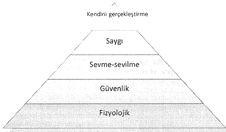
Şekil 1. Maslow'un ihtiyaçlar hiyerarşisi piramidi

önemini yaşlılık döneminde de korumaktadır. Ancak yaş ile birlikte bu ihtiyaçlar şekil ve yer değiştirebilmektedir. Biyolojik yaşlanma ile birlikte ortaya çıkan fizyolojik değişimler, bu farklılaşmanın temelinde yatan belirgin bir unsur olmaktadır. Zira bu dönemde vücut organlarında ve sistemlerinde yapısal ve işlevsel değişimler oluşmakta, kas hücrelerinde kayıplar meydana gelmekte ve yaşsız vücut kütlesi azalmaktadır (Danış, 2004; Yapıcıoğlu, 2009). Birçok eklemde meydana gelen dejeneratif değişiklikler ve kas kütlesi kaybı nedeniyle yaşlılar yavaş hareket etmeye başlayabilmekte ve yürüme zorlukları yaşayabilmektedirler (Boss ve Seegmiller, 1981; Güler ve diğ., 2009). Bu nedenlerle yaşlılıkta sağlık ihtiyaçları ön plana çıkmaktadır. Beslenme, uyuma, dinlenme ve güven içinde olma gibi temel ihtiyaçlarının karşılanması de yaşlı bireyin koşullarına bağlı olarak değişiklik göstermektedir. Bu noktada sağlık hizmetlerine erişim, uygun barınma koşulları ve yaşam alanlarının yaşlı bireyin yaşamını kolaylaştırıcı bir biçimde düzenlenmiş olması önemli bir