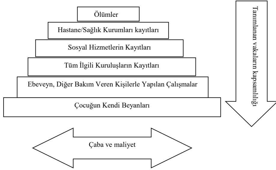
Şekil 2-2: Çocuklara Yönelik Kötü Muamele Gözetimi: Veri Toplama Yöntemleri ve Vakaların Belirlenmesi