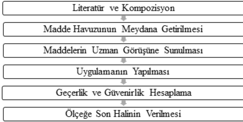
Şekil 1. Ölçek Geliştirme Aşamaları

Araştırmacılar tarafından yapılan incelemeler sonucunda, her ne kadar bu konuyla ilgilenen araştırmacılar (Artan, 2020; Haktanır, 2020; Kırloğlu, 2021) olmuş olsa da böylesi bir ölçme aracının geliştirilmediği görülmüştür. Bu bağlamda araştırmacılar Covid-19 pandemi sürecinde bulunan üniversite öğrencilerinin belirsizliğe tahammülsüzlük düzeylerini belirlemeye yarayan bir ölçme aracının gerekliliği noktasında görüş birliğine varmıştır. Bundan ötürü aşağıda belirtilen yol haritası izlenerek ölçme aracı geliştirilmiştir.