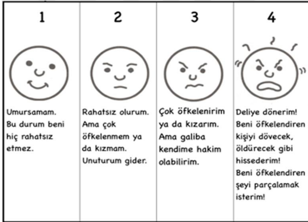
Şekil 1.ÇÖÖ maddelerinin eşleştirildiği resimli sunumlar

Ölçek maddelerinin puanlaması, dörtlü Likert tipi şeklinde sınıflandırılmıştır. Bu sınıflandırma, “Umursamam, bu durum beni hiç rahatsız etmez (1)”, “Rahatsız olurum. Ama çok öfkelenmem ya da kızmam. Unuturum gider (2)”, “Çok öfkelenirim ya da kızarım. Ama galiba kendime hakim olabilirim (3)”, “Dayanamam! Deliye dönerim! Beni öfkeliendiren kişiyi dövcek, öldürecek gibi hissederim! Beni öfkeliendiren şeyi parçalamak isterim! (4)” şeklindedir. Aynı zamanda Nelson ve Finch, saldırgan çocukların kelimelerden çok görsellerle düşündüğüne yönelik önceki araştırmalarından yola çıkarak ölçekteki her bir sayısal seçimi resimli bir sunumla eşleştirmişlerdir. Cevap seçenekleri ve ilgili resimler aşağıdaki Şekil 1’de gösterildiği gibidir: